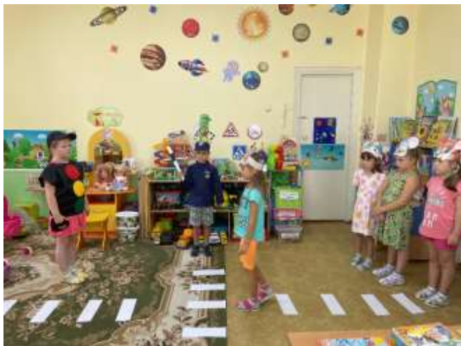
ДОО № 2

(в период с 17 августа по 30 сентября 2022г. )