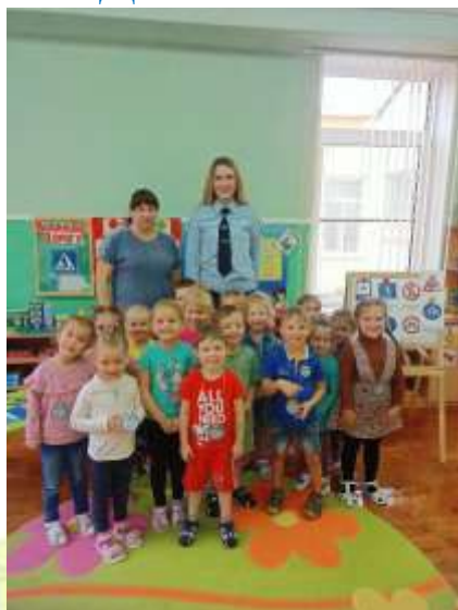
ДОУ № 89