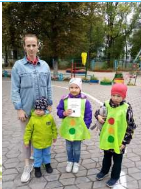
ДОУ № 70