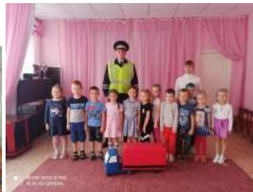
ДОУ № 43