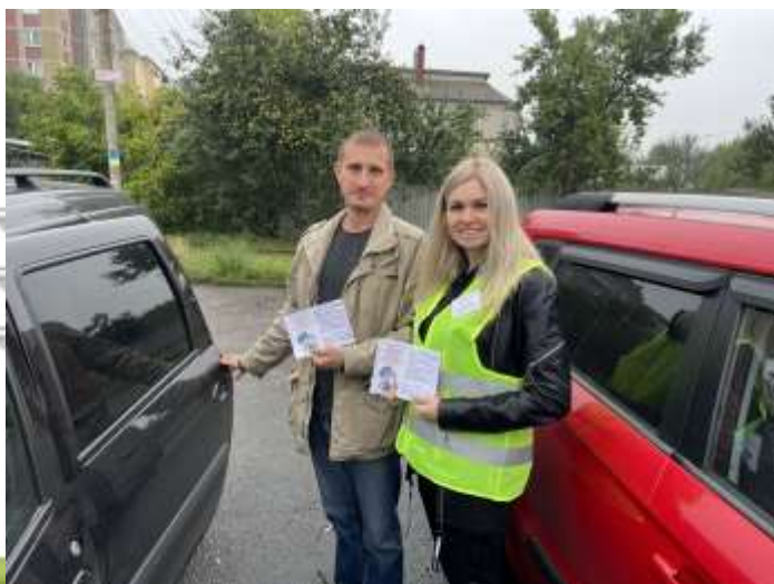
ДОУ № 9