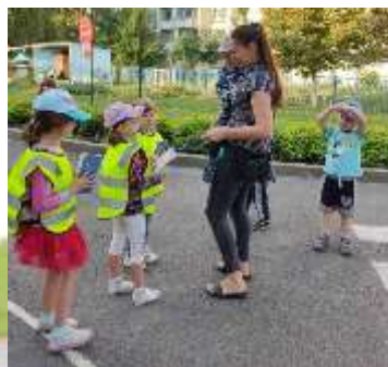
ДОУ № 82