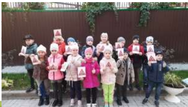
ДОУ № 27