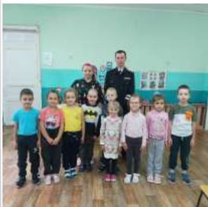
ДОУ № 39